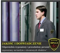
JAKOŚĆ I DOŚWIADCZENIE Odpowiednie wyposażenie i przeszkoleni personel, odpowiedni na każdym etapie realizacji obowiązków.

Personel , każda nasza oferta uwzględnia zatrudnienie doświadczonego i odpowiednio przeszkolonego personelu na podstawie umów o pracę . W trakcie pracy zapewniamy cykliczne szkolenia doskonalące, podnoszenie poziomu wiedzy i kwalifikacji oraz stałą pomoc techniczną i merytoryczną przy wykonywaniu obowiązków.