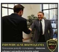
INDYWIDUALNE ROZWIĄZANIA Nowoczesne potrzeby i nowoczesny sprzęt - gwarantujemy najwyższy standard usług.

Gwarancja i bezpieczeństwo - wszystkie osoby są przeszkolone w kierunku bezpiecznego wykonywania obowiązków oraz zachowania tajemnicy służbowej i zawodowej. Na życzenie klienta mogą podpisać klauzulę poufności, wszystkie nasze działania określają odpowiednie jasno sformułowane paragrafy i zapisy w umowie i zakresie obowiązków!