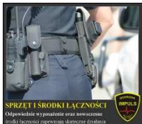
SPRZĘT I ŚRODKI ŁĄCZNOŚCI Odpowiednie wyposażenie oraz nowoczesne środki łączności zapewniają skuteczne działanie.

Nadzór jakości usługi kontroluje całodobowo Inspektor Ochrony, który cyklicznie odwiedza chronione obiekty: kontroluje personel, szkoli i pomaga. Grupy Interwencyjne złożone z wyspecjalizowanych i odpowiednio przeszkolonych pracowników zapewniają błyskawiczne wsparcie pracowników ochrony jeżeli wystąpi taka potrzeba .