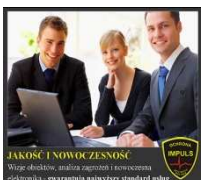
JAKOŚĆ I NOWOCZESNOŚĆ Współczesne potrzeby i nowoczesny sprzęt - gwarantujemy najwyższy standard usług.

Kompleksowe systemy ochrony i zabezpieczeń - nasza ochrona to pełna oferta usług: instalujemy również telewizję przemysłową, systemy alarmowe dla firm i domów, a także systemy kontroli dostępu zintegrowane z kontrolą czasu pracy. Wszystko szybko, sprawnie z fachowym doradztwem podczas jednej wizyty!