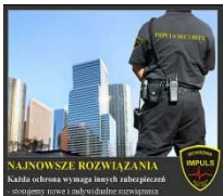
NAJNOWSZE ROZWIĄZANIA Każda ochrona wymaga innych zabezpieczeń - stawiamy sobie i naszym klientom najwyższe wymagania.

Personel , każda nasza oferta uwzględnia zatrudnienie doświadczonego i odpowiednio przeszkolonego personelu na podstawie umów o pracę . W trakcie pracy zapewniamy cykliczne szkolenia doskonalące, podnoszenie poziomu wiedzy i kwalifikacji oraz stałą pomoc techniczną i merytoryczną przy wykonywaniu obowiązków.