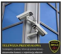
TELEWIZJA PRZEMYSŁOWA Instalujemy systemy telewizji przemysłowej - nierzadko kamery i rejestracja zdarzeń.

ACTIVE GUARD - najnowsze narzędzie z zakresu elektronicznej kontroli i komunikacji wspomaga każdą ochronę fizyczną! Telefon, GPS oraz kontrola czasu pracy w jednym urządzeniu to wygoda oraz nowe możliwości. Teraz również Państwo możecie w dowolnej chwili i miejscu sprawdzić prawidłowość i regularność pracy strażników!