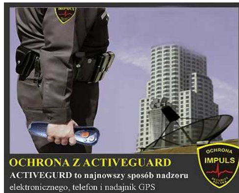
OCHRONA Z ACTIVEGUARD ACTIVEGUARD to najnowszy sposób nadzoru elektronicznego, telefon i nadajnik GPS

ACTIVE GUARD - to jedno z najnowocześniejszych rozwiązań w zakresie wsparcia ochrony elektronicznej obiektów, urządzenie zapewniające funkcję błyskawicznej komunikacji - telefonu, wezwania grup interwencyjnych oraz monitorowania dokładności i regularności obchodów. Co najważniejsze system Active Guard w odróżnieniu od innych urządzeń tego typu, zapewnia nadzór i kontrolę pracowników w czasie rzeczywistym wyświetlając na dowolnym stanowisku komputerowym informacje z obiektów on-line.