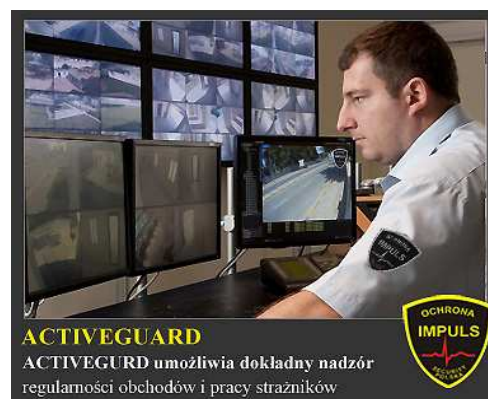
ACTIVEGUARD ACTIVEGUARD umożliwia dokładny nadzór regularności obchodów i pracy strażników

To doskonałe rozwiązanie nadzorujące punktualność i jakość pracy o każdej porze! Każdy z punktów ma swój własny unikalny numer, a wszystkie odstępstwa od regularności zadań są wyświetlane natychmiastowo w Centrum Monitorowania które natychmiast może podjąć niezbędne działania! Dodatkowo zamontowany przycisk w pomieszczeniu pracowników, zapobiega ewentualnemu spaniu podczas pracy. W każdym miejscu i o każdym czasie na dowolnym komputerze możecie Państwo sprawdzić co robią (lub czego nie robią) pracownicy!