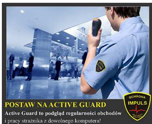
POSTAW NA ACTIVE GUARD Active Guard to podgląd regularności obchodów i pracy strażnika z dowolnego komputera!

Jak faktycznie działa Active Guard? Przy ustalaniu zakresu obowiązków dla pracowników ochrony ustalamy kluczowe punkty obiektu - strategiczne zarówno ze względu bezpieczeństwa jak i częstotliwości oraz rodzaju zagrożeń w danym obszarze. Umieszczamy w każdym z punktów odpowiednie punkty kontrolne (RFID) i określamy częstotliwość obchodów. Urządzenie wymaga od pracownika ochrony aby w określonych przedziałach czasowych dokonał odczytu punktów identyfikatorem ACTIVE GUARD!