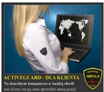
ACTIVE GUARD - DLA KLIENTA Na dowolnym komercyjnym w każdej chwili nasz klient może sprawdzić poprawność pracy.

Profesjonalne, estetyczne i odpowiednio dobrane umundurowanie - stanowić będzie pozytywną wizytówkę zarówno naszej jak i Państwa firmy! Wszyscy pracownicy ochrony wyposażeni są w odpowiedni sprzęt i środki łączności optymalnie dobrane do zadań, które muszą wykonać na chronionym obiekcie!